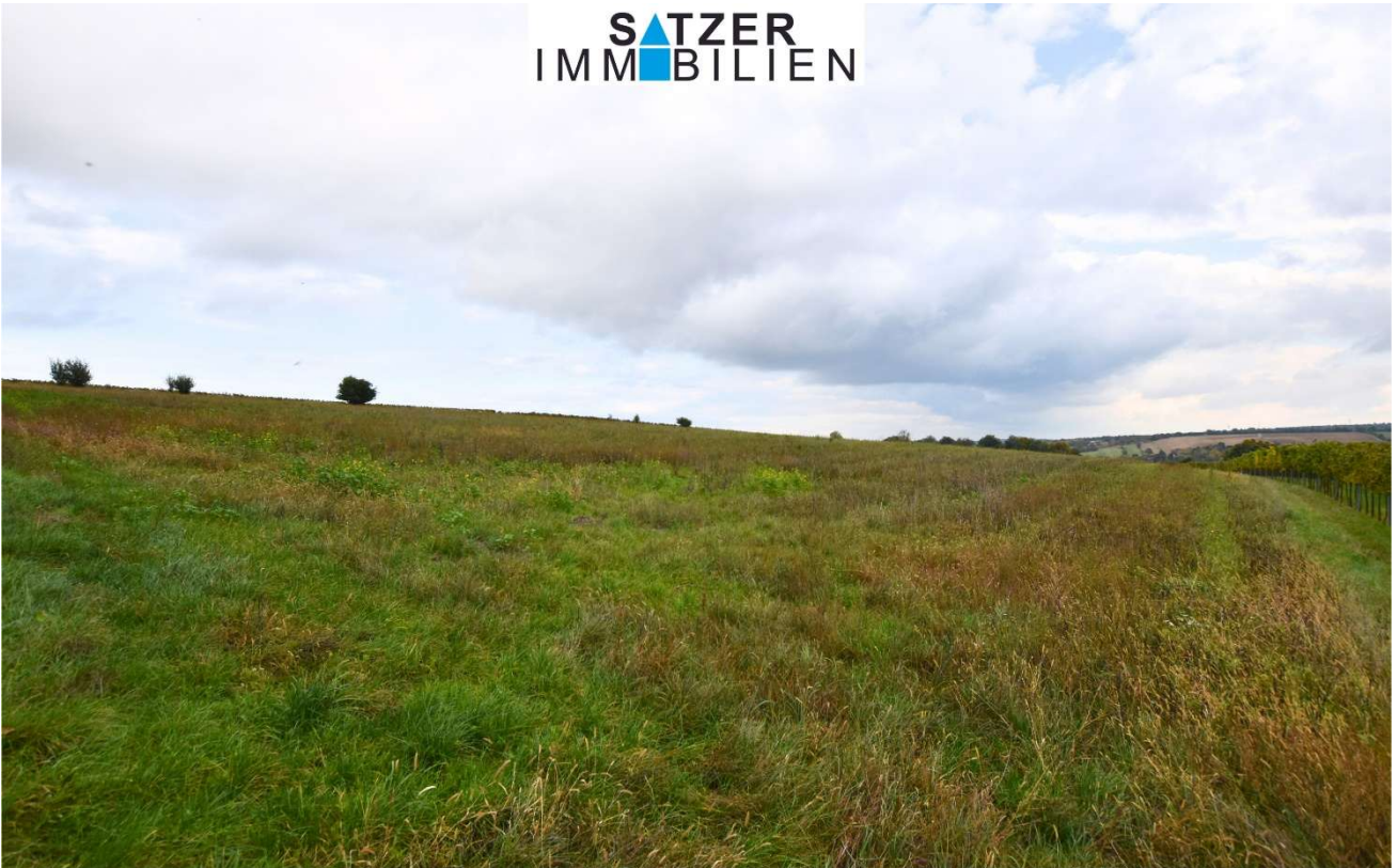
Acker GSt 1842