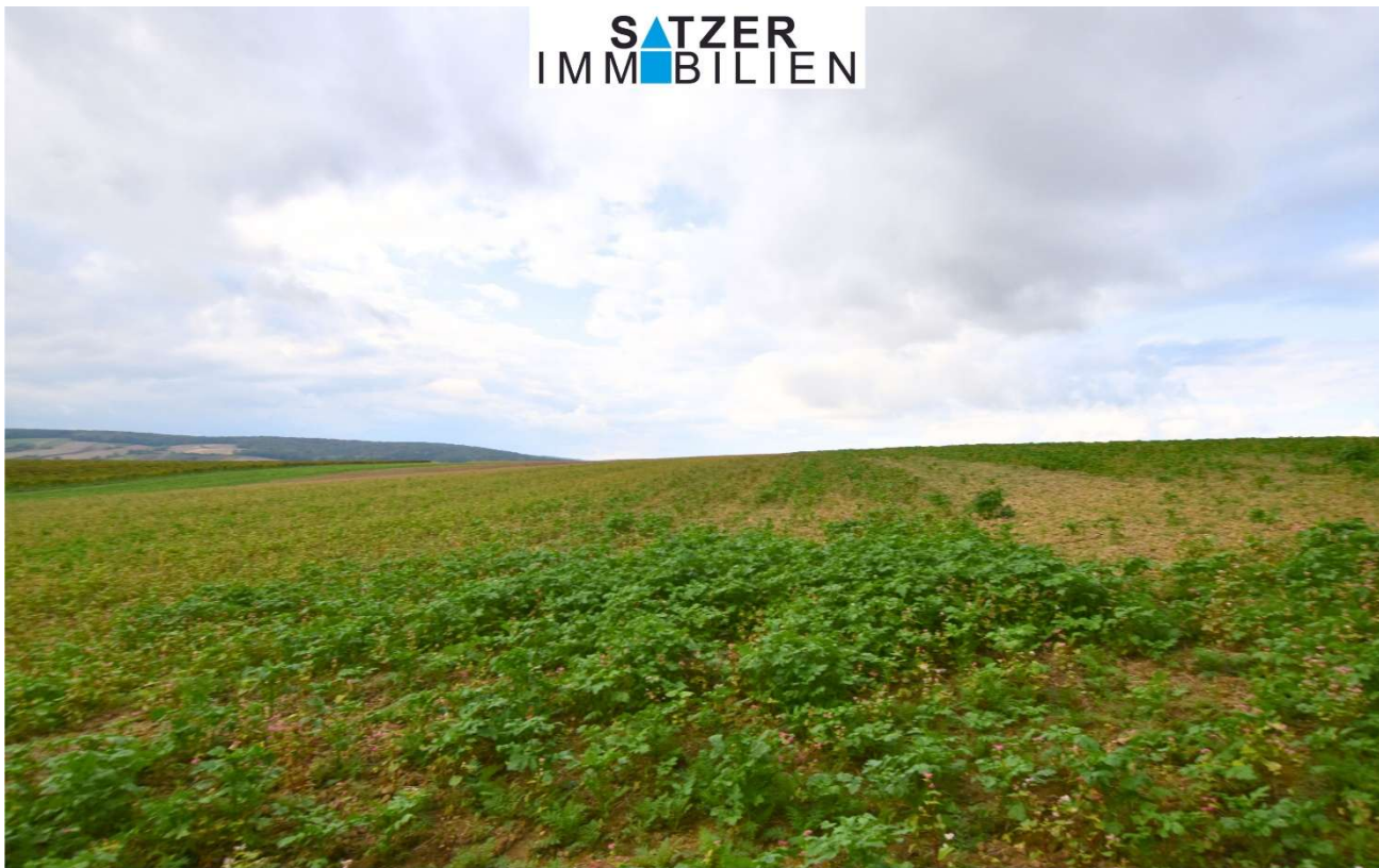
Acker GSt 1837