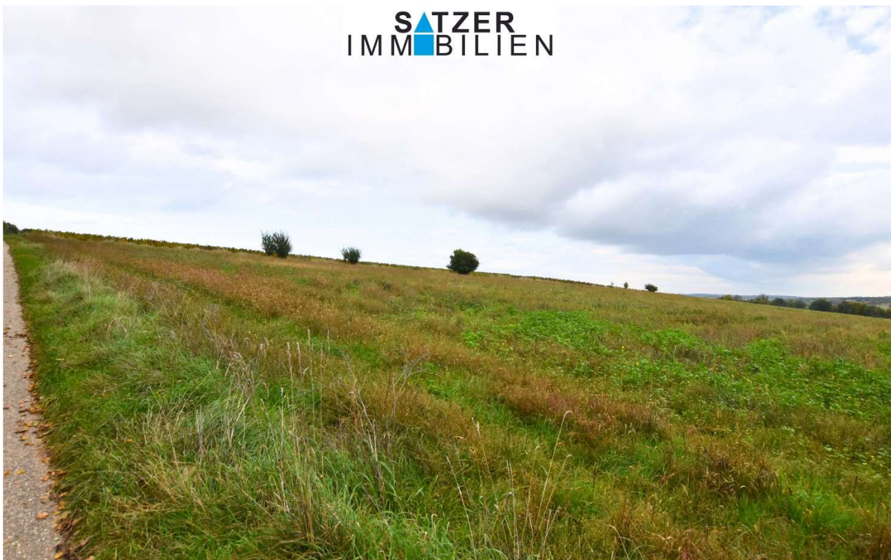
Acker GSt 1842