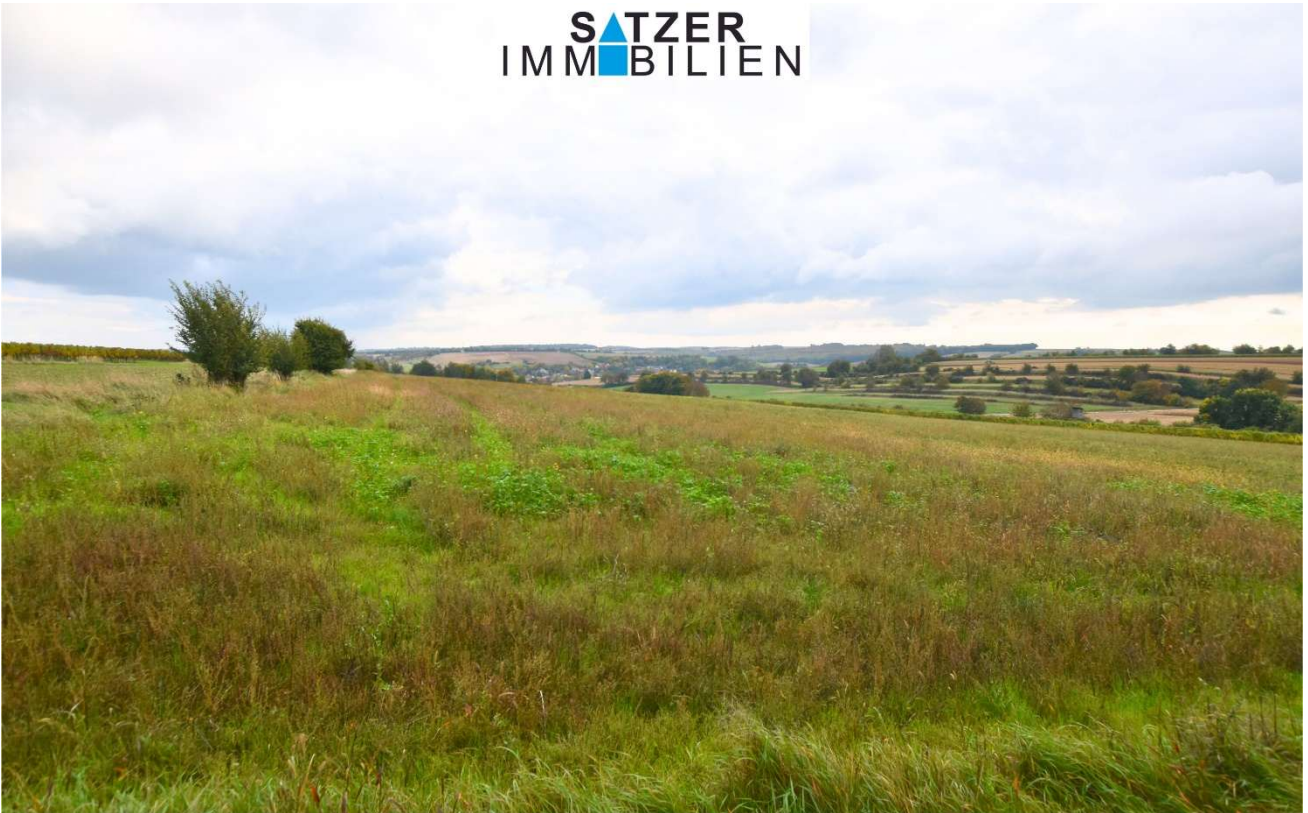
Acker GSt 1842