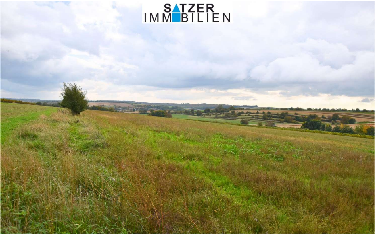
Acker GSt 1842