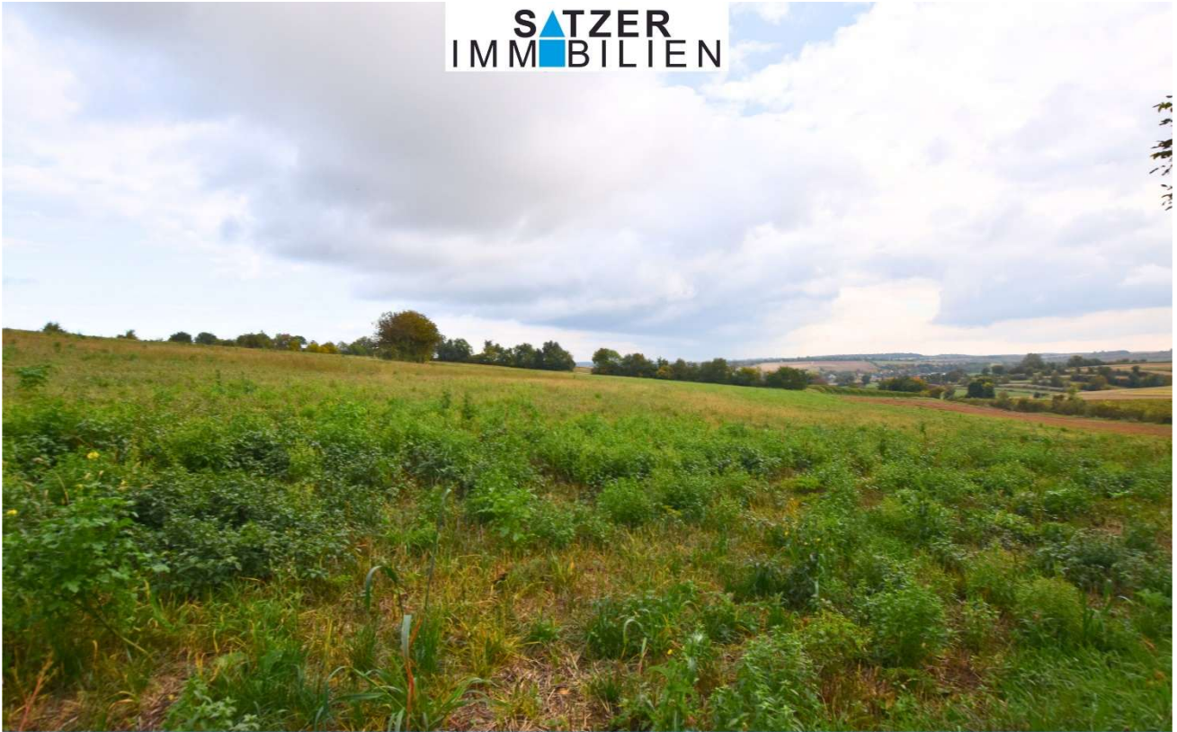
Acker GSt 1837