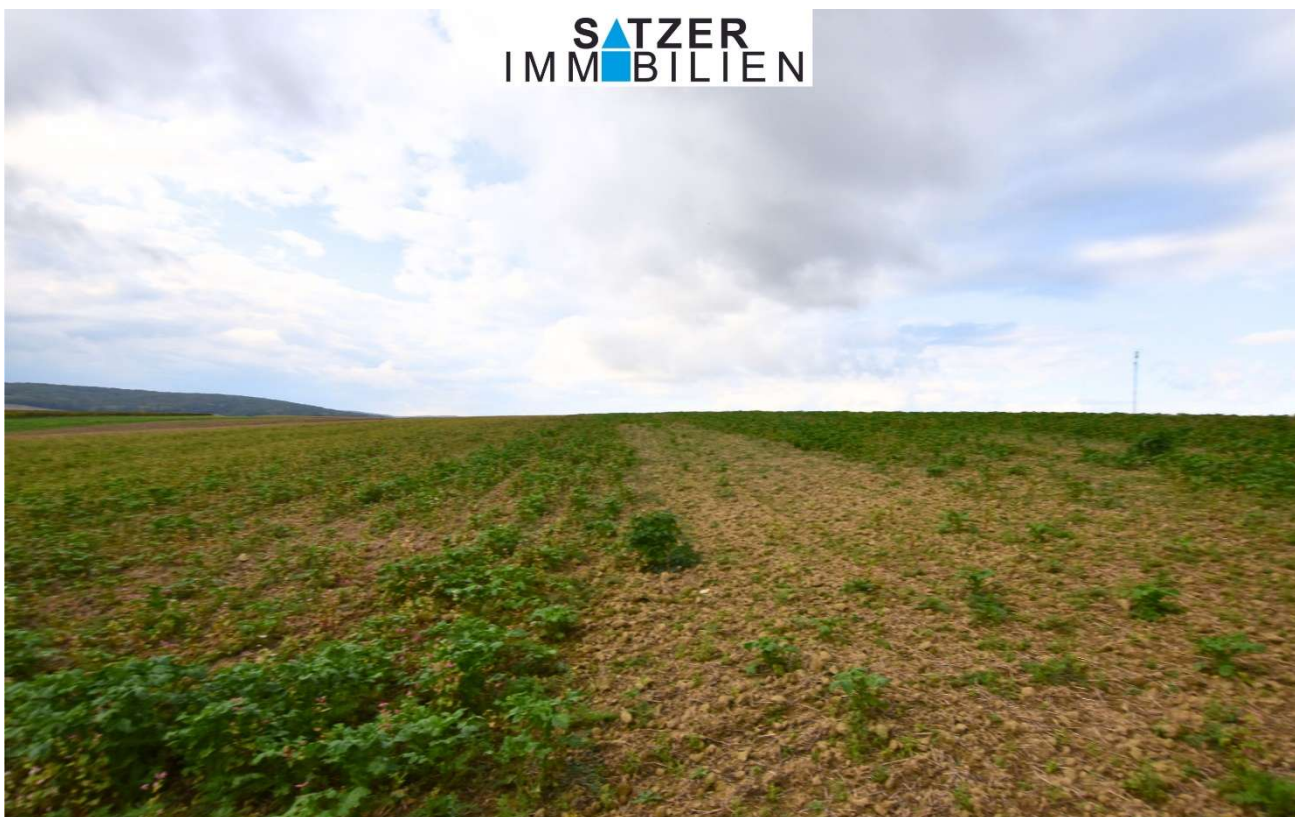
Acker GSt 1837