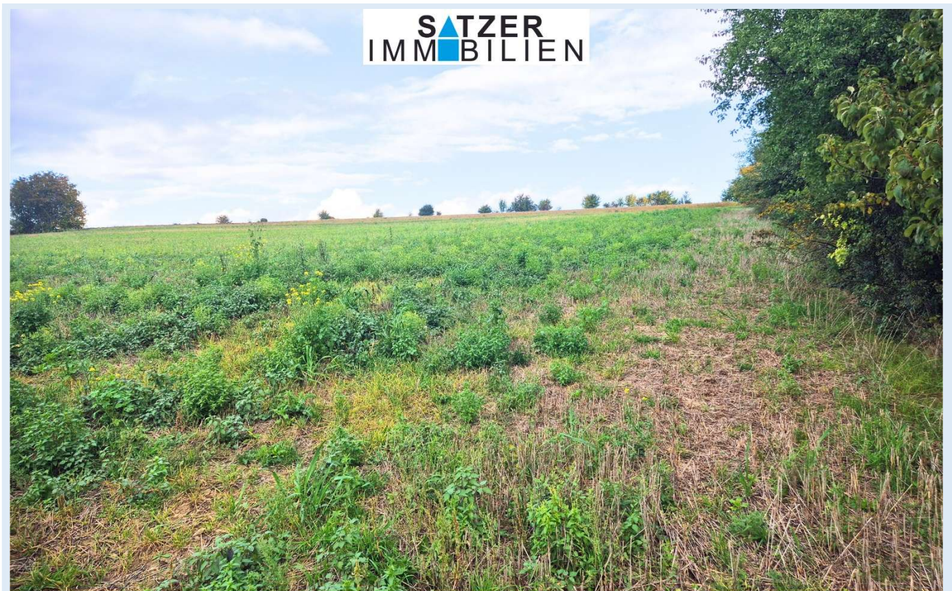
Acker GSt 1837