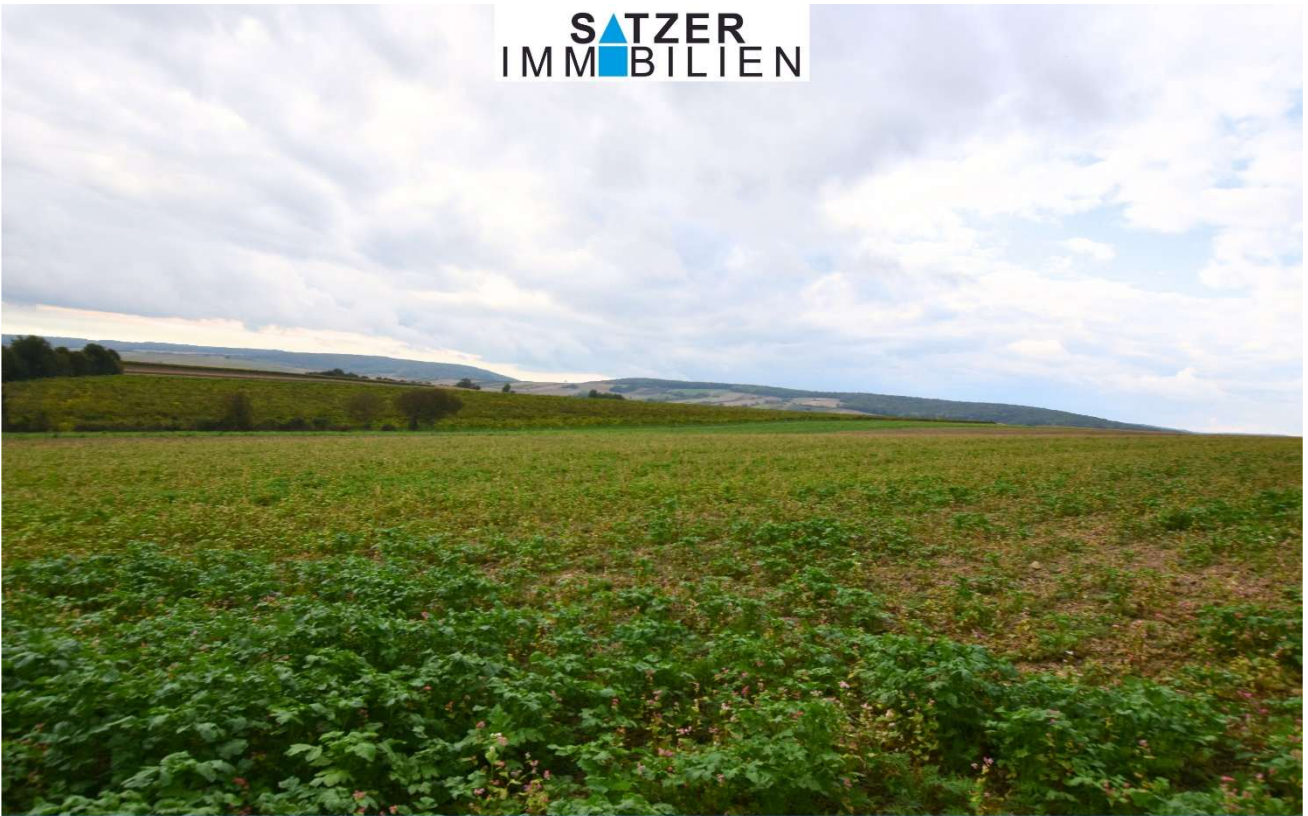
Acker GSt 1837