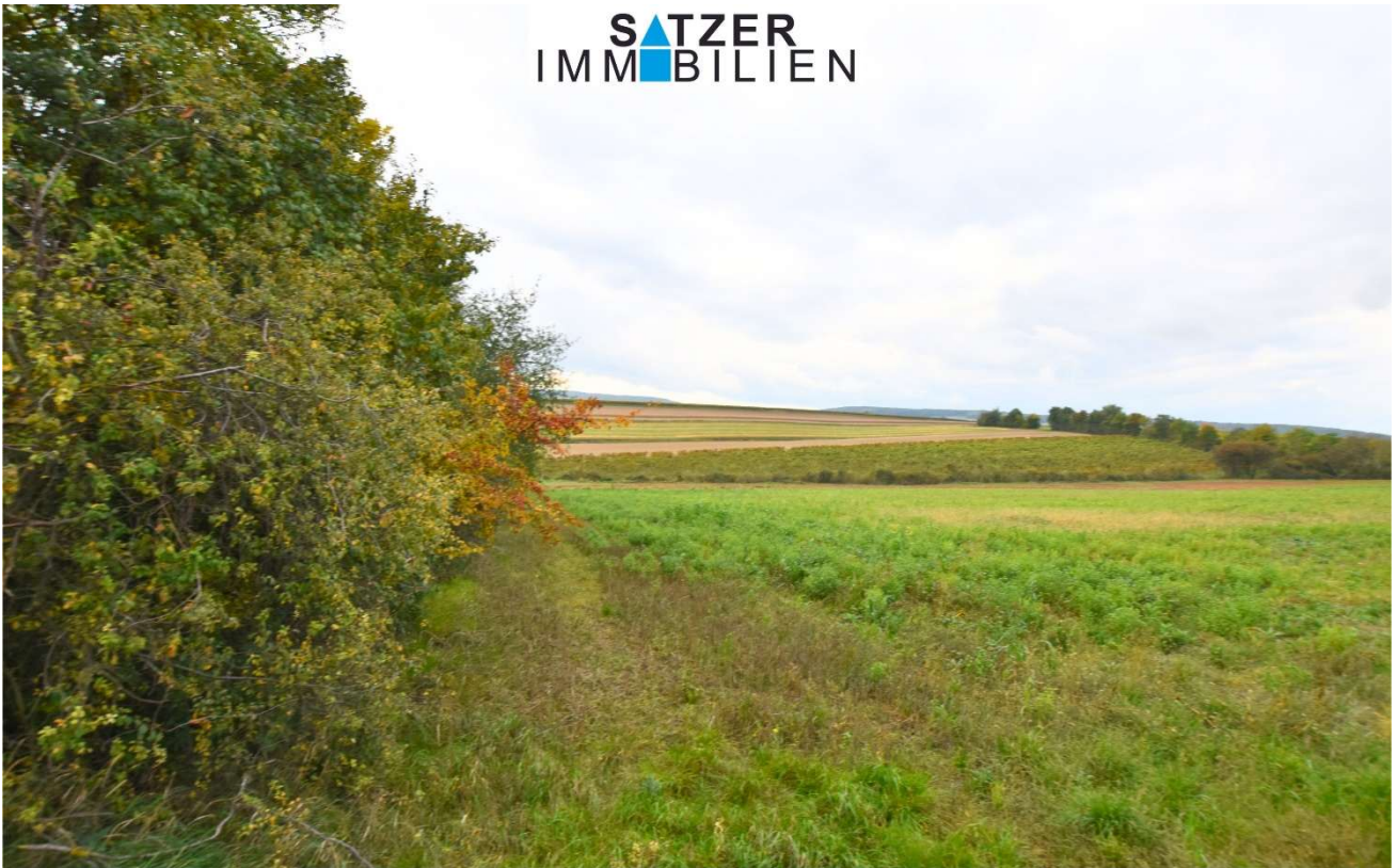
Acker GSt 1837