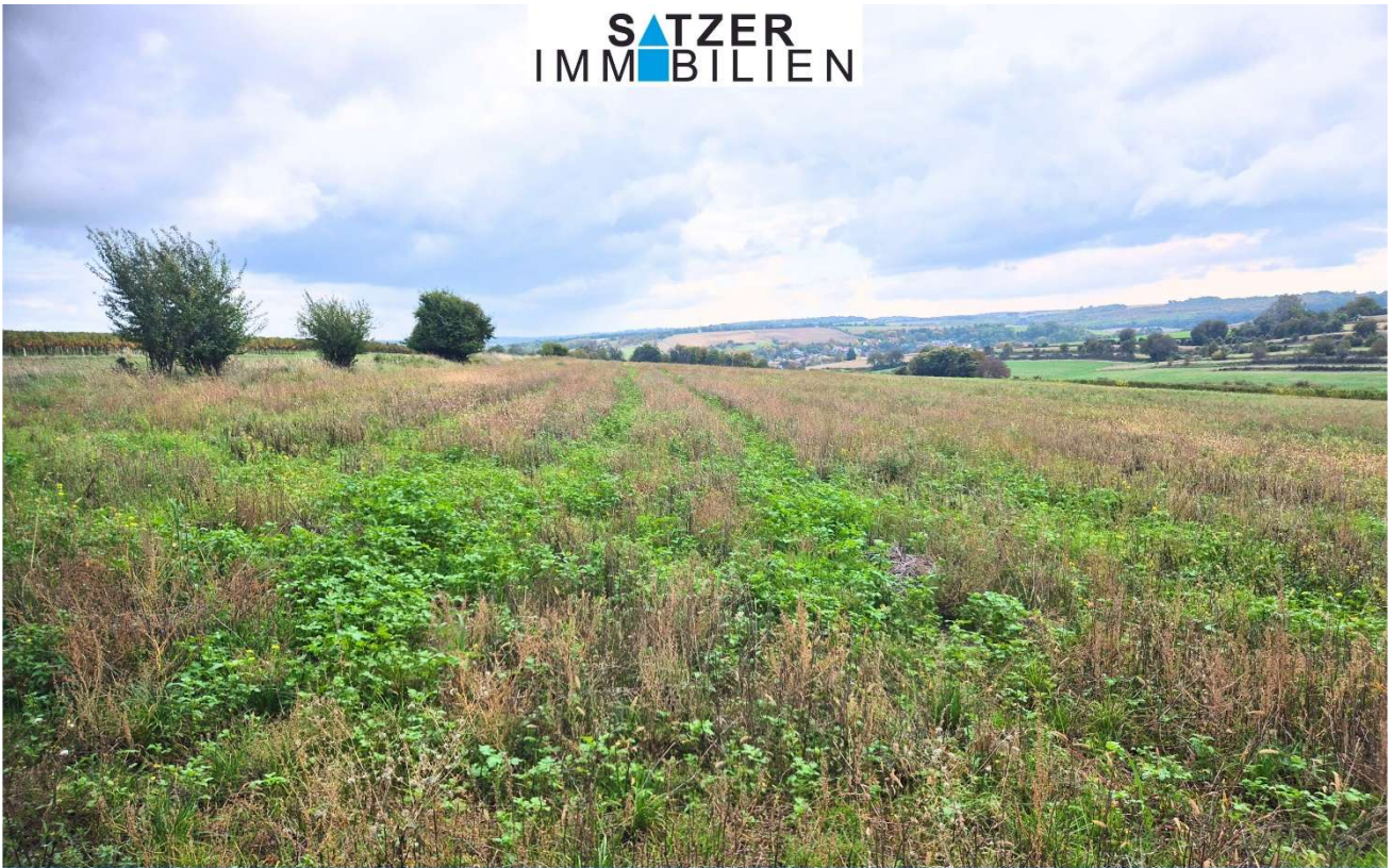
Acker GSt 1842