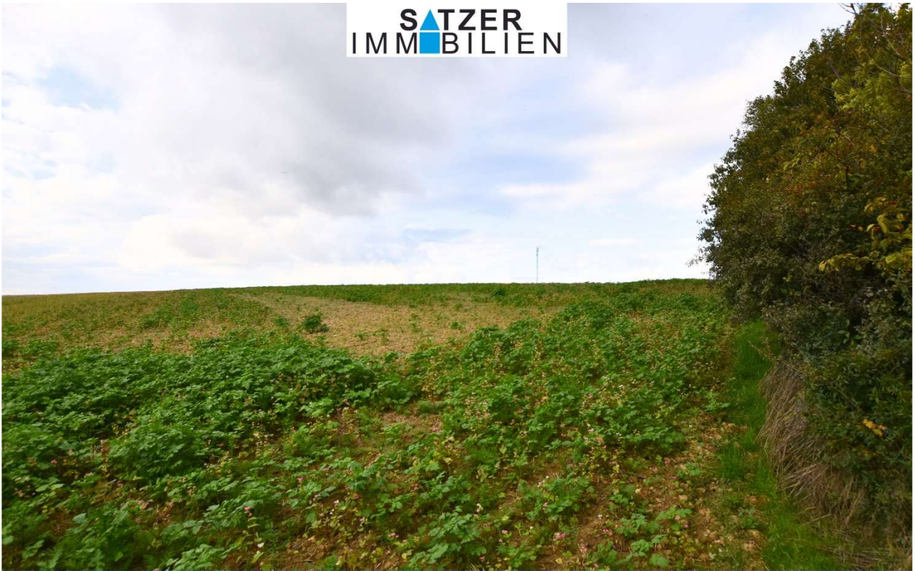
Acker GSt 1837