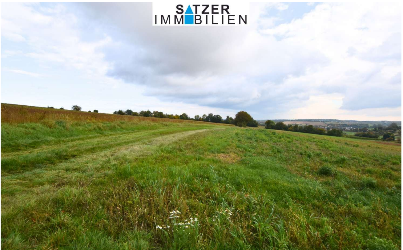
Acker GSt 1837