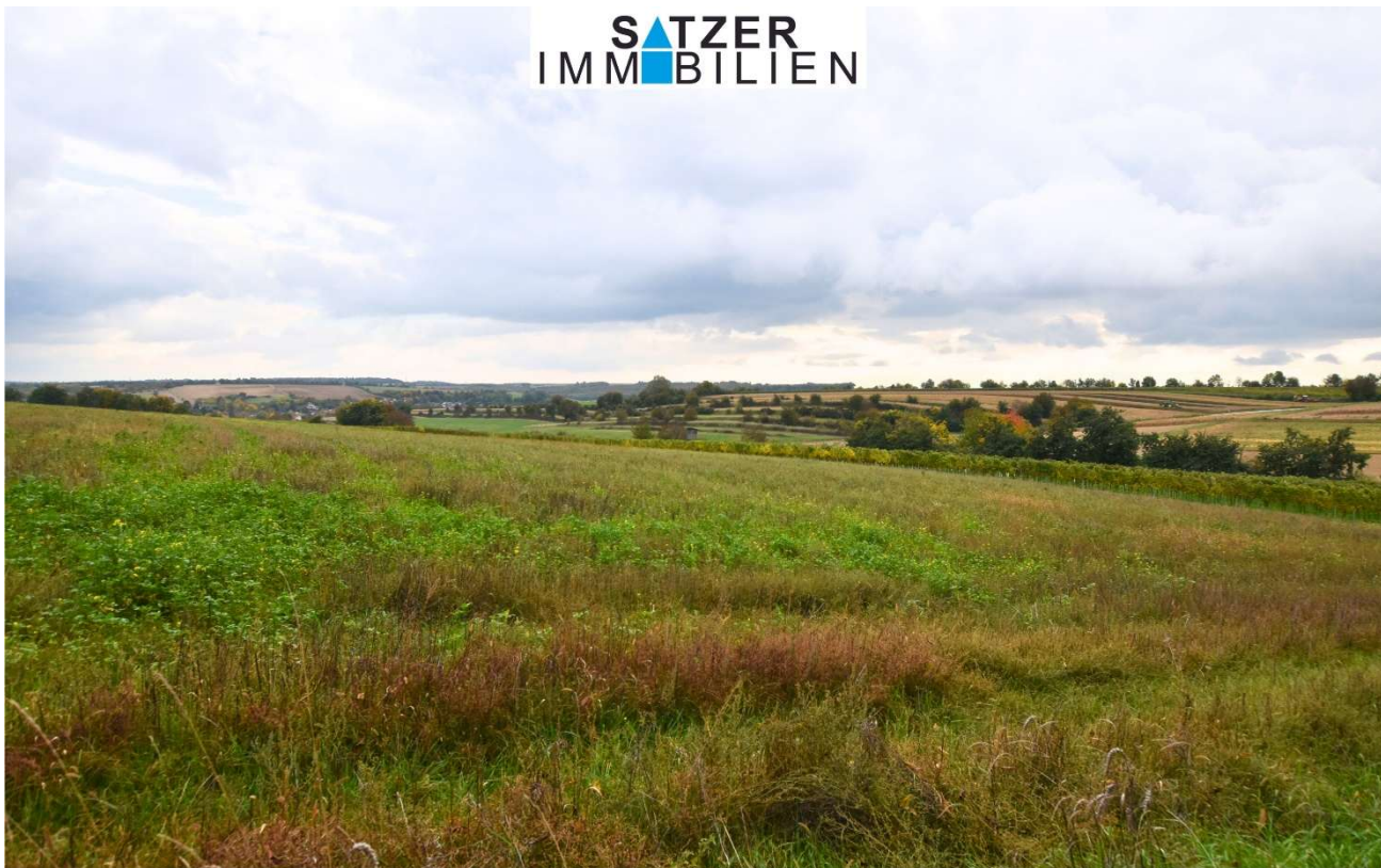
Acker GSt 1842